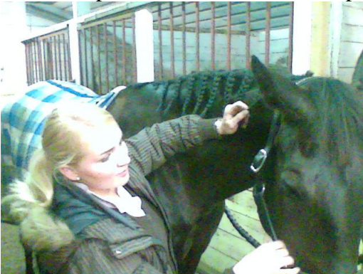
Esteratsastaja letittämässä. Letityksessä tarvitaan etäisyyksien arvioimista ja jokainen esteratsastaja osaa laskea ainakin kolmeen, joten ei ihme että homma sujuu.

Mikäli tunnet jonkun superletittäjän, houkuttele hänet vaikka rahalla avuksesi, sillä letitys on kouluratsastuksessa kaikista vaikein asia. En henkilökohtaisesti tunne ainuttakaan kouluratsastajaa, joka osaa letittää itse. Letitys tehdään edellisenä iltana valmiiksi, jotta et menetä yöuniasi. Näin itse nimittäin koko edellisen yön letityspainajaisia ja yöunet jäivät kahteen tuntiin.. Superletittäjä saattaa olla lähempänä kuin arvaatkaan; kukapa uskoisi, että esimerkiksi esteratsastaja osaa letittää?