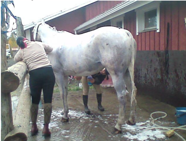
Varoitus: Illalla kimo hevonen saattaa näyttää aamulla keltaiselta. Pese kimo kimoshampoolla. Ruunikot hevosenhoitajat korostavat kauniin kimon väriä.

Tarkista, tarvitseeko sinun pestä kisahevosta. Fiksu hoitaja tekee sen joka tapauksessa. Minulle suurpiirteiselle hoitajatyypille riitti vain vilkaisu: ei tarvitse, sillä ruskea hevonen näytti illalla ruskealta ja musta mustalta.